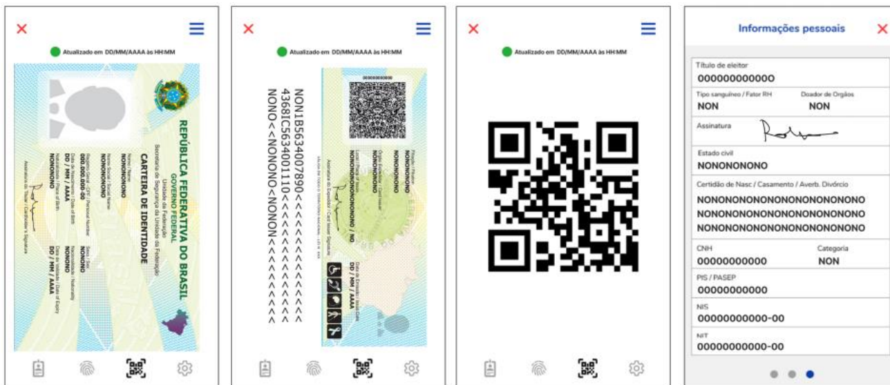
Figura - Imagens das telas principais da aplicação da Carteira de Identidade em formato digital: anverso, reverso, código de barras bidimensional no padrão QR sem conexão à internet e informações pessoais complementares

Art. 4º A Carteira de Identidade em formato digital será expedida conforme as imagens constantes das seguintes figuras: