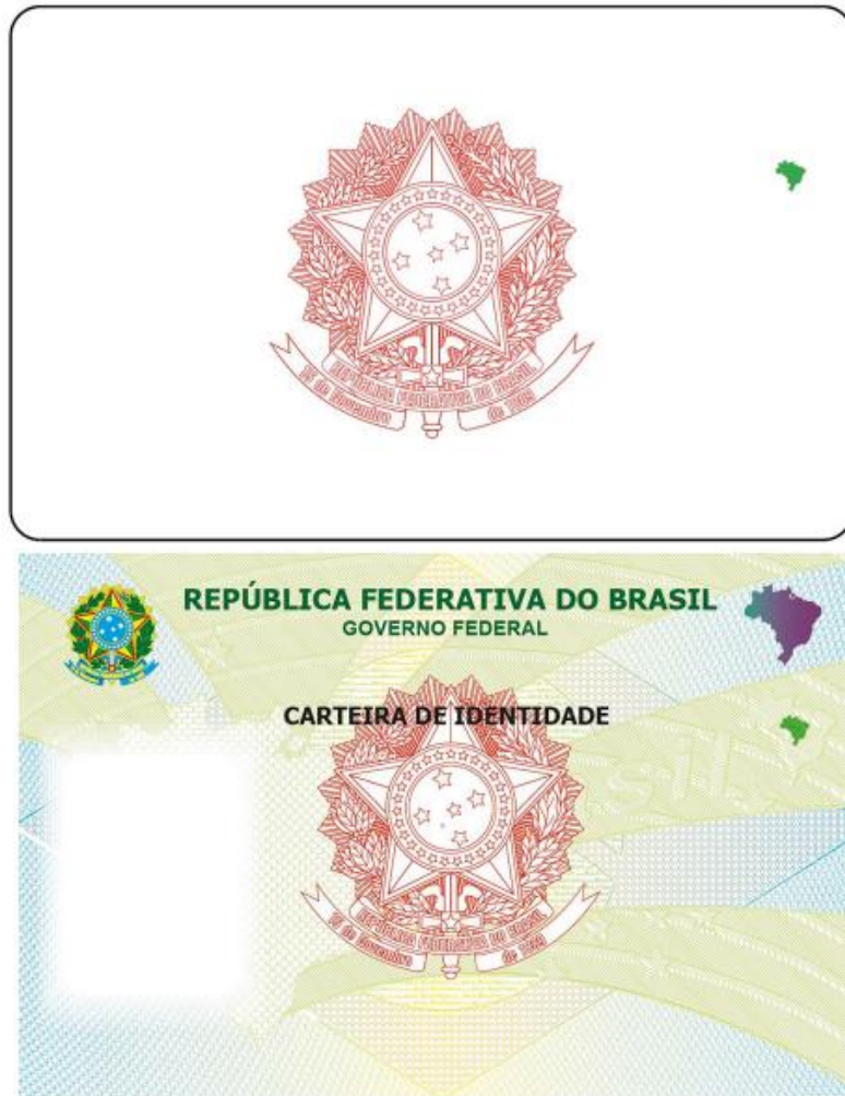
Figura 4 - Imagens dos itens invisíveis do reverso da Carteira de Identidade